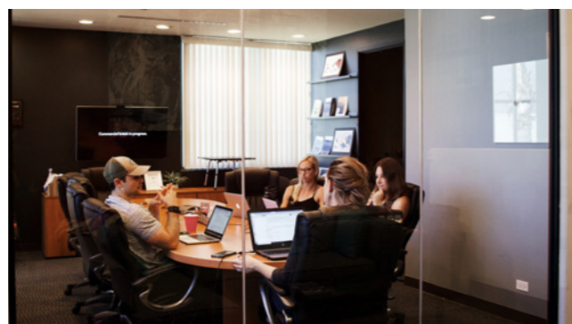
EVENTI E FORMAZIONE