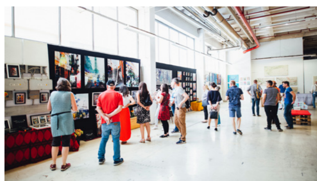
SHOWROOM E NEGOZIO