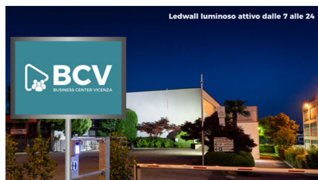
LED WALL E VISIBILITÀ